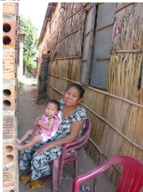
Cluster familial, avec 3 générations vivant dans 3 maisons. La filleule est dans la paillote à gauche