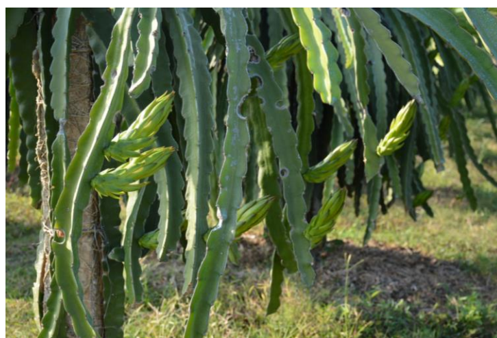
Fruits du dragon. Petites lampes pour faire murir les fruits plus vite