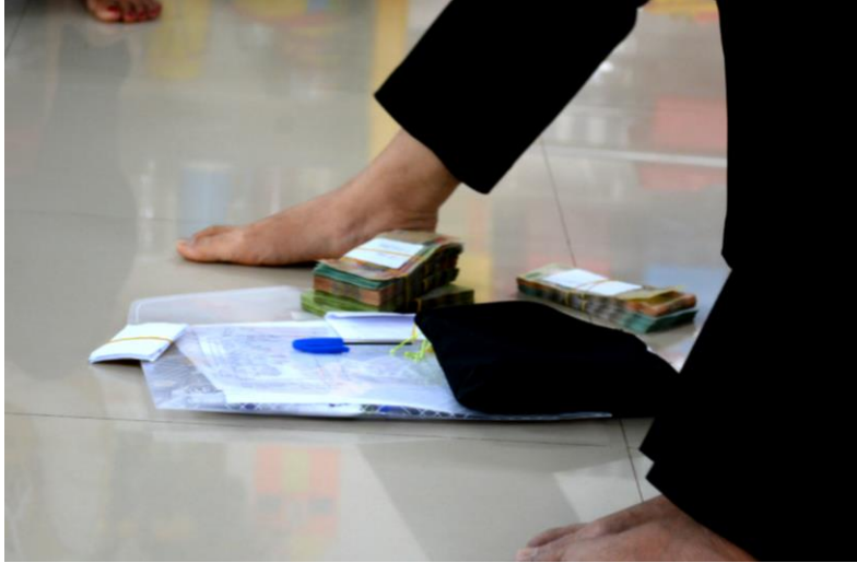
Remise de liasses de billets par Sr Loan pour une nouvelle année;

Les 35 femmes ont emprunté 6.000.000 VND chacune cette année. Il y a 2 nouvelles. Toutes les femmes ont remboursé.